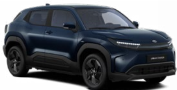
WBH Mélykék metálfényezés felár nélkül Elérhető a Style, Executive felszereltségnél