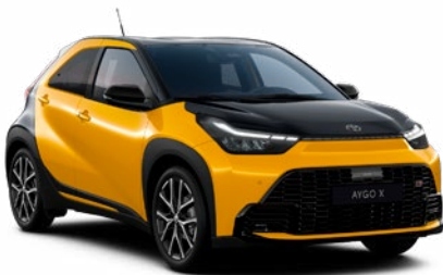
| AYGO X HYBRID