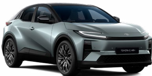
| TOYOTA C-HR+