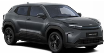
WBF Grafitszürke metálfényezés 270 000 Ft Elérhető a Style, Executive felszereltségnél