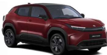
E86 Karminvörös fekete tetővel metálfényezés 365 000 Ft Elérhető az Executive felszereltségnél