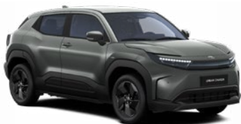
WA1 Sötétzöld metálfényezés 270 000 Ft Elérhető a Style, Executive felszereltségnél