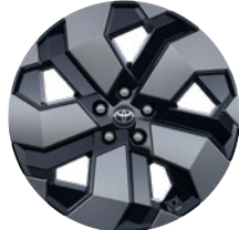
19" könnyűfém keréktárcsák 225/50 R19 gumiabronccsal Elérhető az Executive felszereltségnél