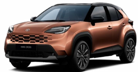
| YARIS CROSS