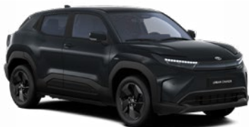
WB3 Bazaltfekete prémium fényezés 350 000 Ft Elérhető a Style, Executive felszereltségnél