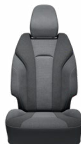
Fekete szövet ülésborítás Elérhető a Style felszereltségnél