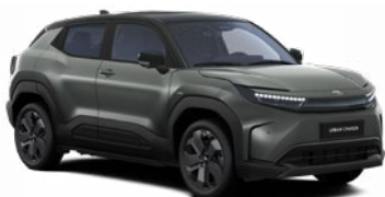
FDC Sötétzöld fekete tetővel metálfényezés 365 000 Ft Elérhető az Executive felszereltségnél