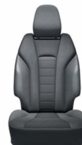
Szintetikus bőr és szövet ülésborítás Elérhető az Executive felszereltségnél