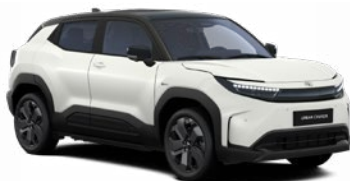
E5G Kristályfehér fekete tetővel prémium fényezés 465 000 Ft Elérhető az Executive felszereltségnél