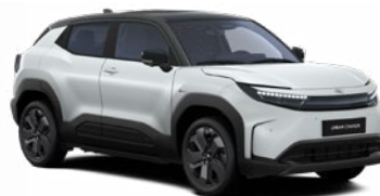
E85 Higanyszürke fekete tetővel metálfényezés 365 000 Ft Elérhető az Executive felszereltségnél