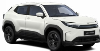
ZHJ Kristályfehér prémium fényezés 350 000 Ft Elérhető a Style, Executive felszereltségnél