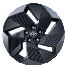
18" könnyűfém keréktárcsák, 225/55 R18 gumiabronccsal Elérhető a Style felszereltségnél