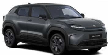
FFZ Grafitszürke fekete tetővel metálfényezés 365 000 Ft Elérhető az Executive felszereltségnél