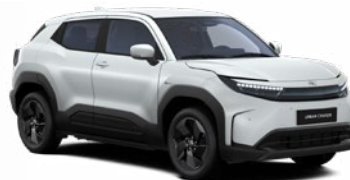
WBE Higanyszürke metálfényezés 270 000 Ft Elérhető a Style, Executive felszereltségnél