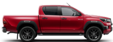
3T6 Lávavörös Metálfényezés nettó 255 000 Ft bruttó 323 850 Ft