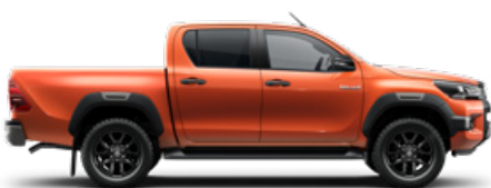
4R8 Narancsmetál Metálfényezés nettó 255 000 Ft bruttó 323 850 Ft