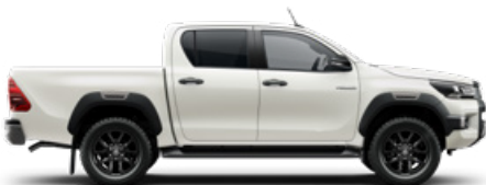
089 Gyöngyfehér* Metálfényezés nettó 310 000 Ft bruttó 393 700 Ft