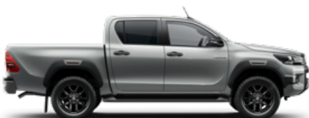
1D6 Ezüstmetál Metálfényezés nettó 255 000 Ft bruttó 323 850 Ft