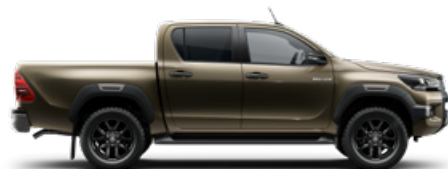
6X1 Barnászöld Metálfényezés nettó 255 000 Ft bruttó 323 850 Ft