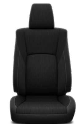
Függőleges mintázatú fekete szövet Alapfelszereltség az Active és Executive modellváltozaton