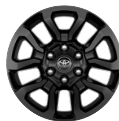
18" fekete könnyűfém keréktárcsa (5 küllős) Alapfelszereltség az Invincible modellváltozaton