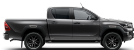
1G3 Hamuszürke Metálfényezés nettó 255 000 Ft bruttó 323 850 Ft