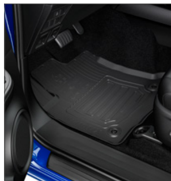
Gumiszőnyeg 40 000 Ft