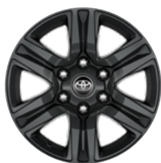
17" sötétszürke könnyűfém keréktárcsa (6 küllős) Alapfelszereltség az Active modellváltozaton