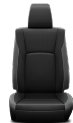
Kéttónusú perforált bőr Alapfelszereltség az Invincible modellváltozaton