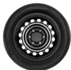
Komplett téli szerelt kerék szett (4 db) 17" acél keréktárcsa, 265/65R17 GOODYEAR SUV téligumi