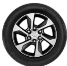
Komplett téli szerelt kerék szett (4 db) 17" könnyűfém keréktárcsa, 265/65R17 BRIDGESTONE LM005 téligumi