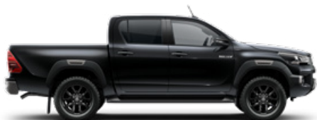
218 Fekete gyöngyház Metálfényezés nettó 255 000 Ft bruttó 323 850 Ft