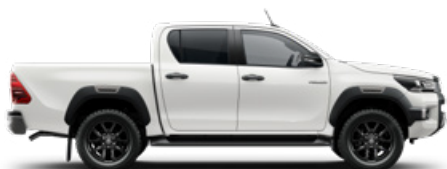
040 Hófehér Alapfényezés felár nélkül