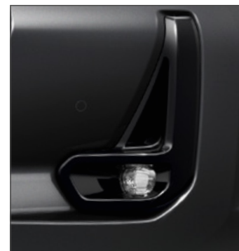
Ködlámpák 376 000 Ft