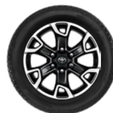
Komplett téli szerelt kerék szett (4 db) 18" könnyűfém keréktárcsa, 265/60R18 CONTINENTAL WINTERCONTACT TS870P téligumi