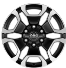
18" fekete, csiszolt felületű könnyűfém keréktárcsa (6 küllős) Alapfelszereltség az Executive modellváltozaton