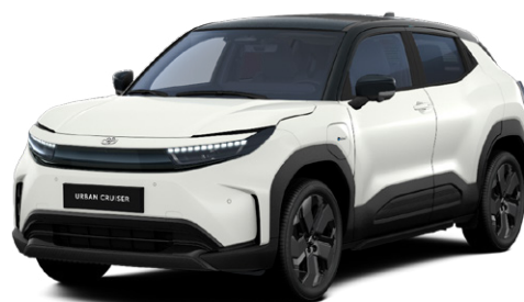
| URBAN CRUISER