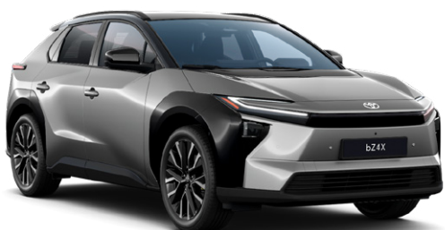
| TOYOTA BZ4X