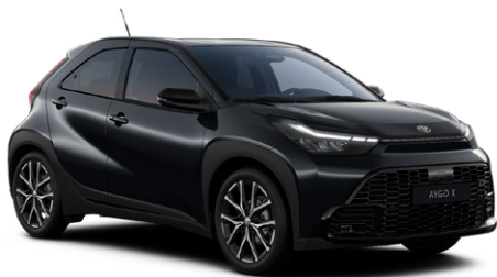
209 Éjfékete fekete tetővel