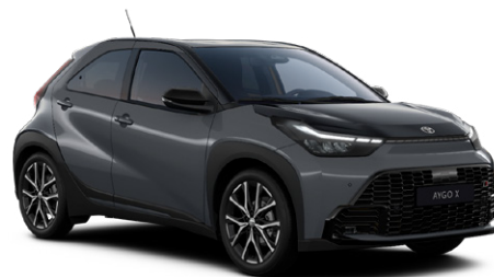
M52 Viharszürke fekete tetővel