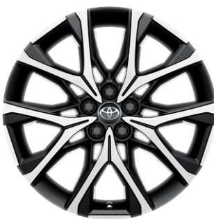
18" könnyűfém keréktárcsák (GR SPORT), 175/60 R18 gumibroncs Alapfelszereltség: GR SPORT