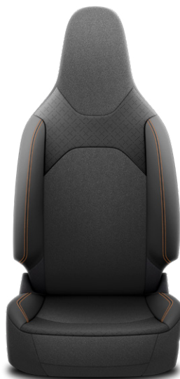
"SakuraTouch" fekete prémium szövet ülésborítás Alapfelszereltség: Executive