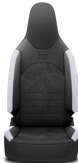
GR SPORT fekete prémium (részben "SakuraTouch", "Dinamica" velúr és suede elemekkel) Alapfelszereltség: GR SPORT