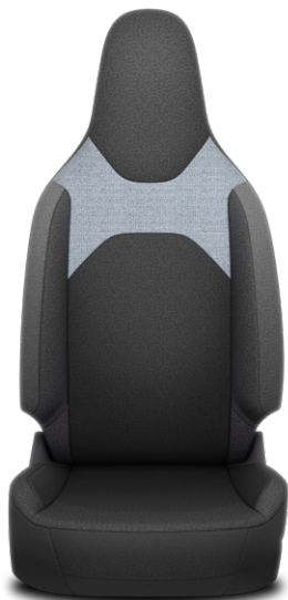
Fekete szövet ülésborítás Alapfelszereltség: Active és Comfort