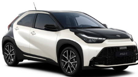
2PU Platinafehér fekete tetővel