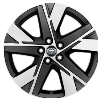
17" könnyűfém keréktárcsák (Style), 175/65 R17 gumibroncs Alapfelszereltség: Style