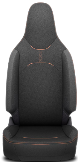
Fekete szövet ülésborítás Alapfelszereltség: Style