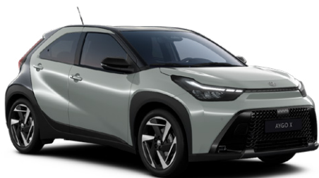
2VN Olivazöld fekete tetővel

Elérhető a Active és Comfort felszereltségnél