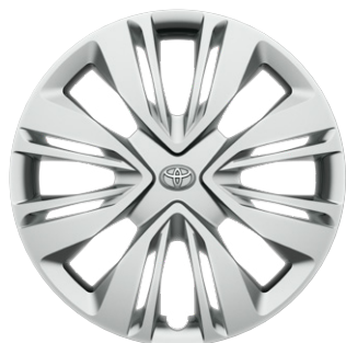
17" lemezfelni teljes méretű dísz tárcsával, 175/65 R17 gumibroncs Alapfelszereltség: Active