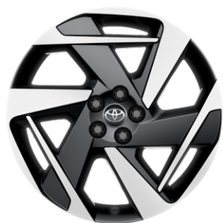
18" könnyűfém keréktárcsák (Executive), 175/60 R18 gumibroncs Alapfelszereltség: Executive