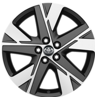
17" könnyűfém keréktárcsák (Comfort), 175/65 R17 gumibroncs Alapfelszereltség: Comfort