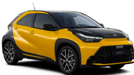
M50 Mustársárga fekete tetővel

Elérhető a Style és Executive felszereltségnél