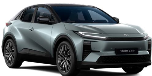
| TOYOTA C-HR+