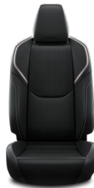
Fekete mesterséges bőr ülésborítás Széria az Executive szereltségben