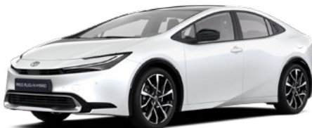
089 Gyöngy fehér 300 000 Ft