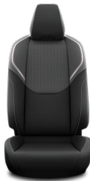
Fekete szövet ülésborítás Széria a Comfort és Prestige szereltségekben