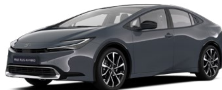
1M2 Hamu szürke* 300 000 Ft