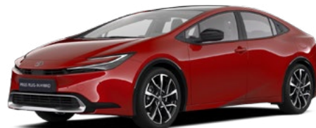
3U5 Érzéki Vörös 300 000 Ft