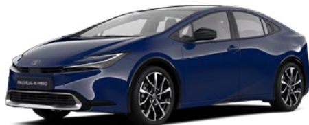
8Q4 Sötétkék felár nélkül