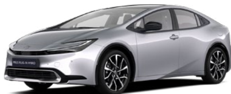
1L0 Palladium ezüst* 200 000 Ft