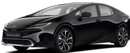
218 Fekete metál* 200 000 Ft