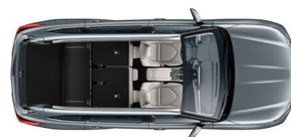
2 ülésel 1909* liter