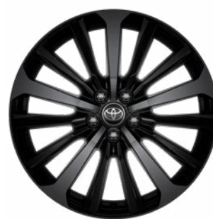
20" fekete könnyűfém felni 235/55 R20 gumiabronccsal Alapfelszereltség az Executive modellváltozaton