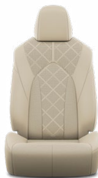
Bézs perforált bőr, gyémántmintázatú, fekete varrással Alapfelszereltség az Executive modellváltozaton