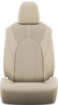
Bézs perforált bőr, steppelt, fekete varrással Alapfelszereltség a Prestige modellváltozaton