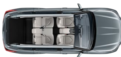
5 ülésel 865* liter