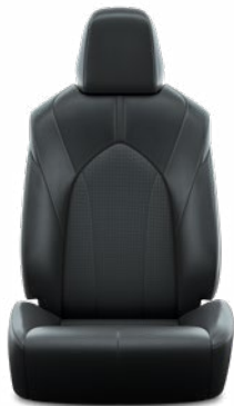
Fekete perforált bőr, steppelt, fekete varrással Alapfelszereltség a Prestige modellváltozaton