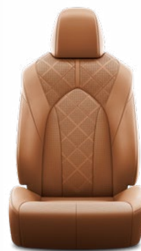
Nyeregbarna perforált bőr, gyémántmintázatú, fekete varrással Alapfelszereltség az Executive modellváltozaton