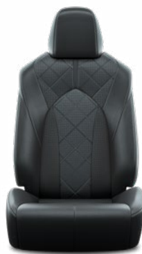
Fekete perforált bőr, gyémántmintázatú, fekete varrással Alapfelszereltség az Executive modellváltozaton