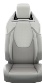
Világosszürke szövet ülésborítás bőr részekkel és steppelt szürke betétekkel, szürke varrással Alapfelszereltség az Executive és Hybrid Executive felszereltségnél