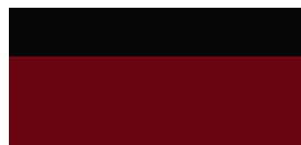
2SZ GR SPORT Passion felár nélkül