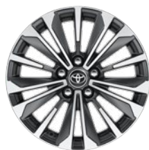
17" könnyűfém keréktárcsák 225/45 R17 gumiabronccsal Alapfelszereltség: Style