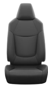
Fekete szövet ülésborítás Alapfelszereltség az Active felszereltségnél