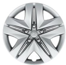
16" acél keréktárcsák 205/55 R16 gumiabroncsok dízeltárcsával Alapfelszereltség: Active