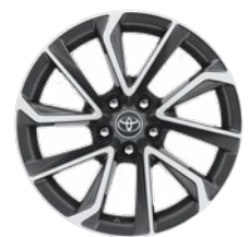
18" könnyűfém keréktárcsák 225/40 R18 gumiabroncsok Alapfelszereltség: Executive