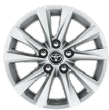
16" könnyűfém keréktárcsák 205/55 R16 gumiabronccsal Alapfelszereltség: Comfort és Comfort + Tech