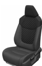
Fekete szövet ülésborítás steppelt fekete betétekkel Alapfelszereltség a Comfort, Comfort Tech és Comfort Style Tech felszereltségnél