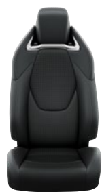
Fekete szövet ülésborítás bőr részekkel és steppelt betétekkel, bézs varrással Alapfelszereltség az Executive és Hybrid Executive felszereltségnél