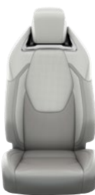
Világosszürke szövet ülésborítás bőr részekkel és steppelt szürke betétekkel, szürke varrással Alapfelszereltség az Executive és Hybrid Executive felszereltségnél