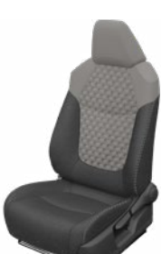
Szürke szövet ülésborítás steppelt világosszürke betétekkel Alapfelszereltség a Comfort, Comfort Tech és Comfort Style Tech felszereltségnél