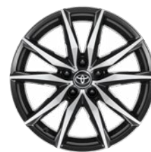
18" könnyűfém keréktárcsák 225/40 R18 gumiabronccsal Alapfelszereltség: GR SPORT + Dynamic