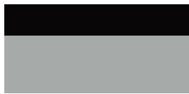
2TX GR SPORT Prémium ezüst felár nélkül