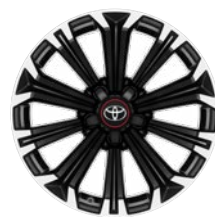
17" könnyűfém keréktárcsák 225/45 R17 gumiabroncsok Alapfelszereltség: GR SPORT