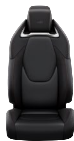
Sötétszürke szövet és szintetikus bőr ülésborítás GR SPORT logoval Alapfelszereltség a GR SPORT és GR SPORT Dynamic felszereltségnél