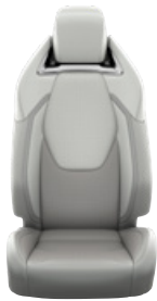
Világosszürke szövet ülésborítás bőr részekkel és steppelt szürke betétekkel, szürke varrással Alapfelszereltség az Executive és Hybrid Executive felszereltségnél