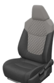
Szürke szövet ülésborítás steppelt világosszürke betétekkel Alapfelszereltség a Comfort, Comfort Tech és Comfort Style Tech felszereltségnél