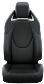
Fekete szövet ülésborítás bőr részekkel és steppelt betétekkel, bézs varrással Alapfelszereltség az Executive és Hybrid Executive felszereltségnél