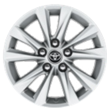
16" könnyűfém keréktárcsák 205/55 R16 gumiabronccsal Alapfelszereltség: Comfort és Comfort + Tech