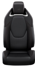
Sötétszürke szövet és szintetikus bőr ülésborítás GR Sport logoval Alapfelszereltség a GR Sport és GR SPORT Dynamic felszereltségnél