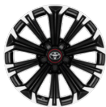
17" könnyűfém keréktárcsák 225/45 R17 gumiabroncsok Alapfelszereltség: GR SPORT