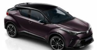
2XE Mély ametisztlila / fekete tető metálfényezés csak a GR SPORT változatban rendelhető