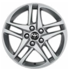
17" ezüstszerű könnyűfém keréktárcsa (5 dupla küllős) Széria a Comfort modellváltozaton