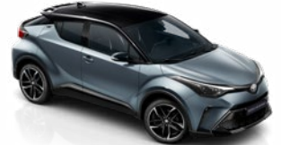
2TH Szürkéskék / fekete tető metálfényezés csak a GR SPORT változatban rendelhető