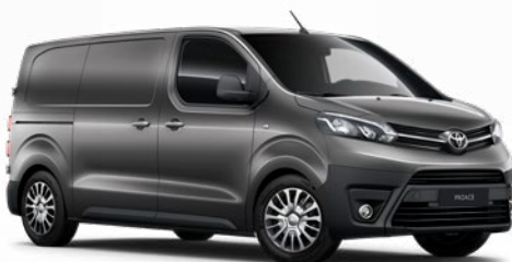
EVL Sólyomszürke Metálfényezés, (nettó ár/bruttó ár): 160 000 Ft/203 200 Ft