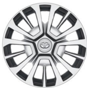
16" acél keréktárcsák dísz tárcsával