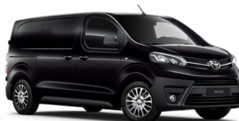
KTV Éjfékete Metálfényezés, (nettó ár/bruttó ár): 160 000 Ft/203 200 Ft