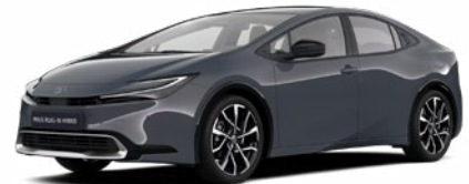
1M2 Hamu szürke* 300 000 Ft