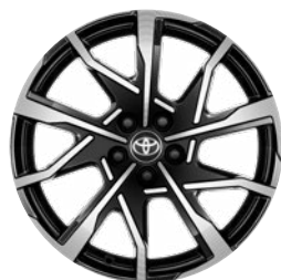
19" csiszolt hatású fekete könnyűfém keréktárcsák 195/50 R19 gumiabroncsokkal Széria a Prestige és Executive szereltségben