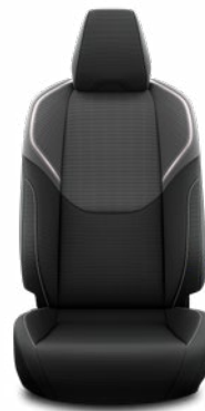
Fekete szövet ülésborítás Széria a Comfort és Prestige szereltségekben