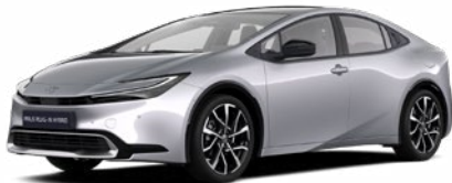
1L0 Palladium ezüst* 200 000 Ft