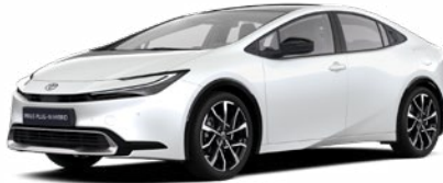
089 Gyöngy fehér 300 000 Ft