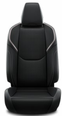
Fekete mesterséges bőr ülésborítás Széria az Executive szereltségben