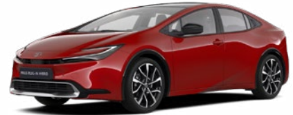
3U5 Érzéki Vörös 300 000 Ft