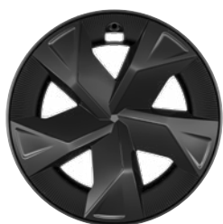
17" sötétszürke könnyűfém keréktárcsák aerodinamikai terelővel 195/60 R17 gumiabroncs Széria a Comfort szereltségnél