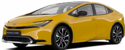
5C5 Mustársárga metál* 200 000 Ft