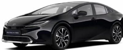
218 Fekete metál* 200 000 Ft