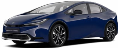
8Q4 Sötétkék felár nélkül