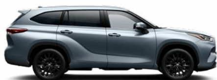
1K5 Holdfény prémium metálfényezés