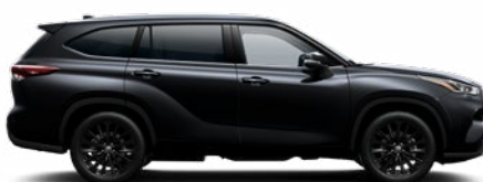
218 Fekete gyöngyház metálfényezés

A Highlander ügyfélárak tartalmazzák a metálfény felárat, a prémium fényezés felárat a Premium felszereltségek tartalmazza.