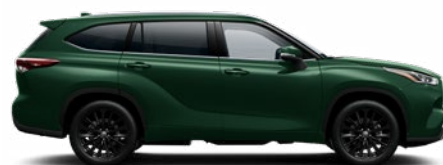
6X5 Ciprus zöld metál metálfényezés