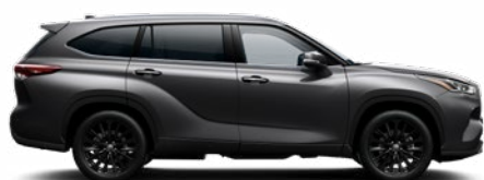
1G3 Hamuszürke metálfényezés