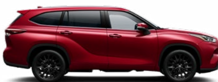
3T3 Vörös prémium metálfényezés