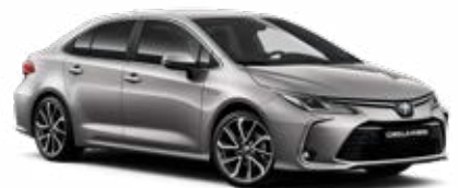
1K0 Higanyezüst* 145 000 Ft