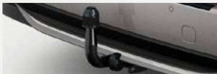
Vonóhorog csomag 241 700 Ft