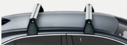
Tetőcsomagtartó 87 100 Ft