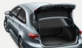
Hátsó lökhárítóvédő-fólia 18 400 Ft