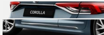
Króm csomag 98 000 Ft