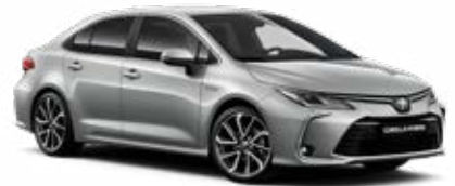
1F7 Ultraezüst* 145 000 Ft