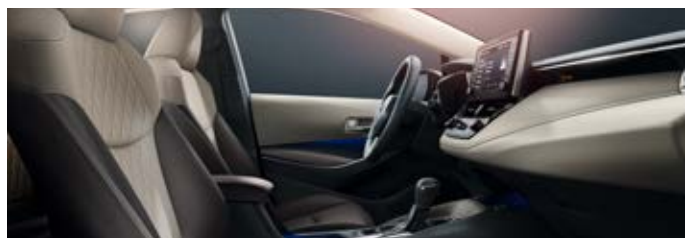
Világos szövet ülésborítás (FB00) A képeken Executive felszereltség látható.