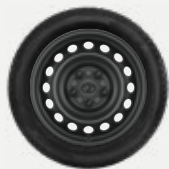
Komplett téli szerelt kerék 236 800 Ft/4db 16"-os téli szerelt kerék acélfelnnivel és Semperit Speed-Grip 3 gumiabronccsal