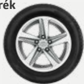
Komplett téli szerelt kerék 352 200 Ft/4db 16"-os téli szerelt kerék alufelnnivel és 205/55 R16 91H Bridgestone LM005 gumiabronccsal