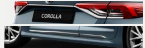
Króm csomag 98 000 Ft