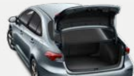
Hátsó lökhárítóvédő-fólia 18 400 Ft