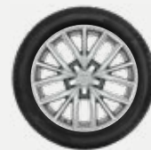
Komplett téli szerelt kerék 449 400 Ft/4db 17"-os téli szerelt kerék alufelnnivel és Continental WinterContact TS 860 gumiabronccsal

Autójához vásárolt téli szerelt kerekek mellé 3 évig tartó (a nyári gumiabroncsra is vonatkozó) gumibiztosítást adunk ajándékba! A további részletekkel kapcsolatban érdeklődjön márkakereskedőjénél!