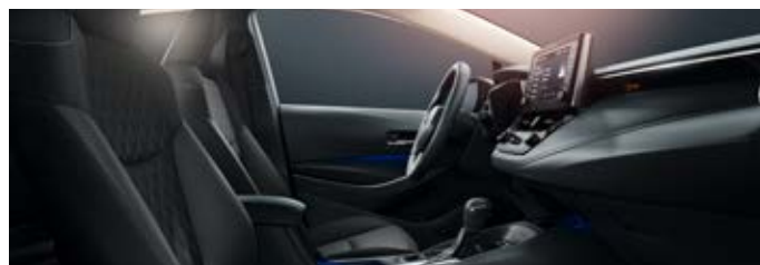
Fekete szövet ülésborítás (FB20)