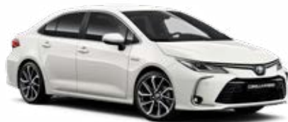
040 Hófehér felár nélkül