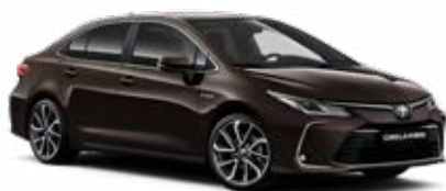
4W9 kávébarna* 145 000 Ft