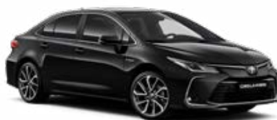
209 Éjfékete* 145 000 Ft