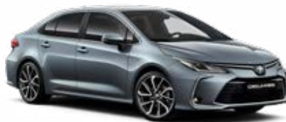
1K3 Szürkéskék metál* 145 000 Ft