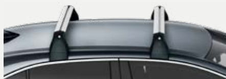
Tetőcsomagtartó 87 100 Ft