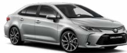
1F7 Ultraezüst* 145 000 Ft