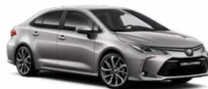
1K0 Higanyezüst* 145 000 Ft