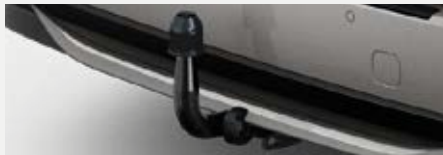
Vonóhorog csomag 241 700 Ft