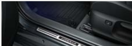
Gumiszőnyeg garnitúra 17 600 Ft