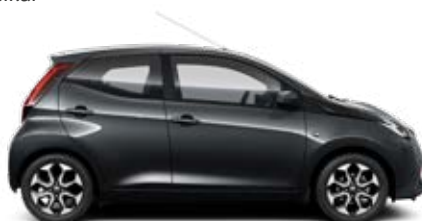
1E0 Antracitszürke metálfényezés 120 000 Ft