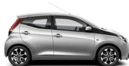
1E7 Szaténézüst metálfényezés 120 000 Ft