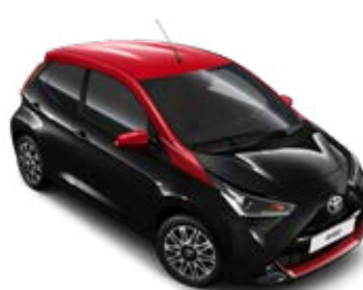
211 Éjfékete Érzéki vörös tetővel metálfényezés Selection x-cite szín felár nélkül