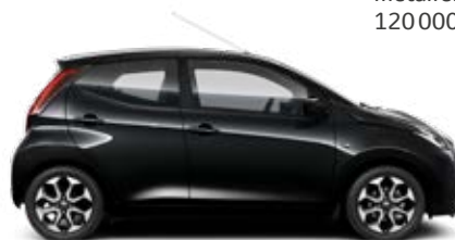
211 Éjfékete metálfényezés 120 000 Ft