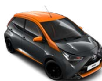
1E0 Antracitszürke mandarinsárga tetővel metálfényezés JBL Edition szín felár nélkül