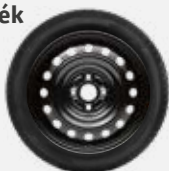
Komplett téli szerelt kerék 184 400 Ft/4db 15"-os téli szerelt kerék acélfelnível és Semperit Master-Grip 2 gumibronccsal