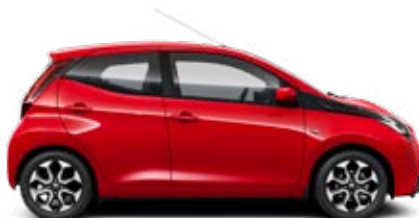
3P0 Tűzpiros 45 000 Ft