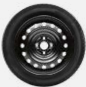
Komplett téli szerelt kerék 186 400 Ft/4db 14"-os téli szerelt kerék acélfelnível és Bridgestone LM005 gumibronccsal