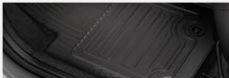
Gumiszőnyeg garnitúra 20 600 Ft