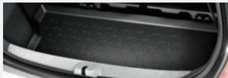
Csomagtértálca 16 100 Ft