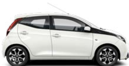
068 Hófehér felár nélkül