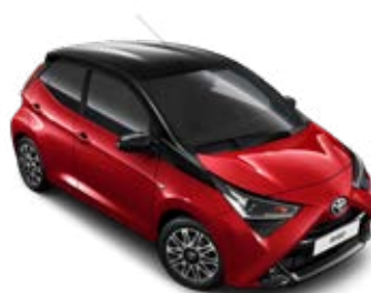
3U5 Érzéki vörös fekete tetővel metálfényezés Selection x-cite szín felár nélkül