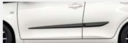
Oldalvédőcsík készlet 31 700 Ft