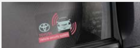
Riasztó 80 000 Ft