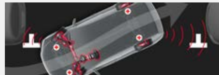
Hátsó parkolásegítő rendszer szereléssel 74 000 Ft