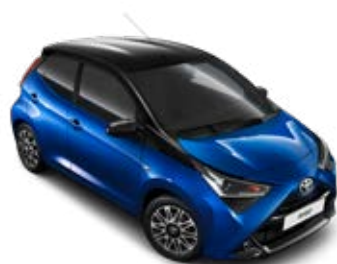
8Y5 Királykék fekete tetővel metálfényezés Selection x-cite szín felár nélkül