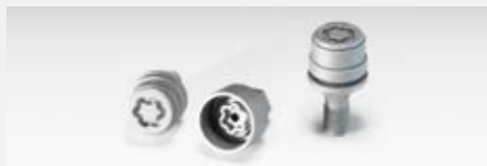
Kerékőr 20 500 Ft