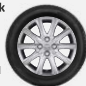
Komplett téli szerelt kerék 346 300 Ft/4db 15"-os téli szerelt kerék alufelnível és Continental WinterContact TS 860 gumibronccsal

Autójához vásárolt téli szerelt kerekek mellé 3 évig tartó (a nyári gumibroncsra is vonatkozó) gumbiztosítást adunk ajándékba! A további részletekkel kapcsolatban érdeklődjön márkakereskedőjénél!