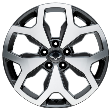
18" Diamond Cutting könnyűfém keréktárcsák 235/55 R18 gumibroncsokkal