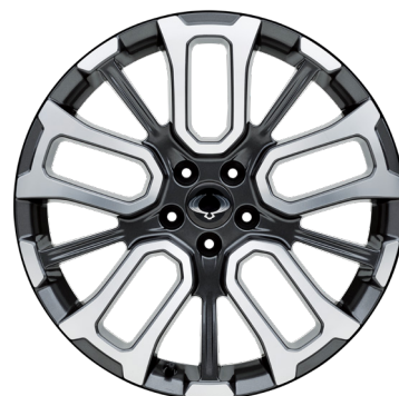
20" Diamond Cutting könnyűfém keréktárcsák 245/45R R20 gumibroncsokkal