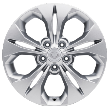
17" könnyűfém keréktárcsák 225/60 R17 gumibroncsokkal