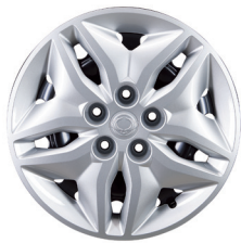
16" acél keréktárcsák 205/65 R16 gumikkal