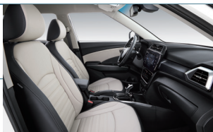
Soft beige/szürke kéttónusú beltér (EBG)