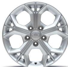
16" könnyűfém keréktárcsák 205/65 R16 nyári gumikkal