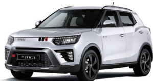
GRAND fehér (WAA)