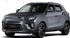
PLATINUM grafit metál (ADA)