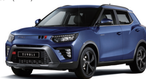
DANDY kék metál (BAS)