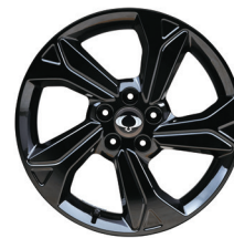
18" Diamond Cutting fekete fényezésű könnyűfém keréktárcsák 215/50 R18 gumikkal