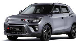
IRON metál (ADE)