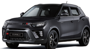
SPACE fekete metál (LAK)