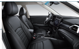
Fekete egytónusú beltér (LBH)