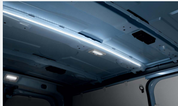
LED csomagtér világítás