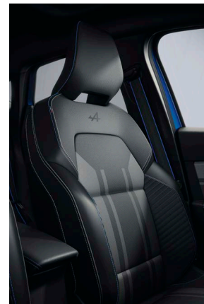
esprit Alpine kárpitozás kék varrással