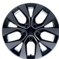
17" könnyűfém fekete-ezüst kéttónusú ERIDIS keréktárcsák