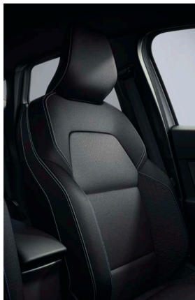
evolution kárpitozás kék varrással