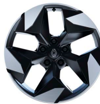
18" könnyűfém fekete-ezüst kéttónusú BLACK HOLE keréktárcsák