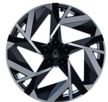
19" könnyűfém fekete-ezüst kéttónusú ELIXIR keréktárcsák