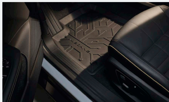
27 890 Ft-tól