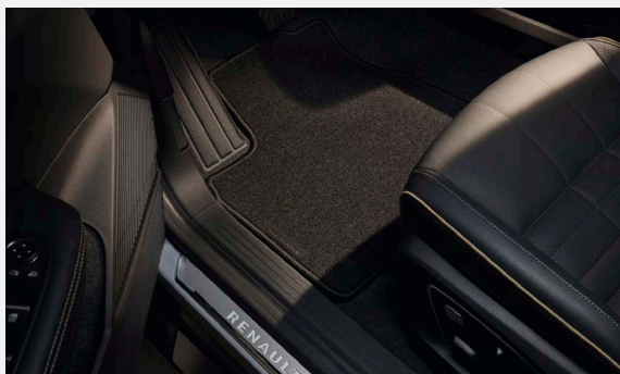
4 db-os gumi- vagy textilszőnyeg szett