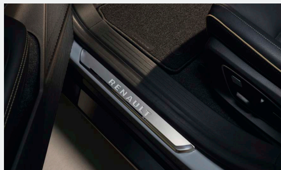
246 090 Ft

4 A feltüntetett árak az RN Hungary Kft. ajánlott árai, a tartozékok és tartozék csomagok beszerelési munkadíjáról érdeklődjön a Renault márkakereskedésekben!