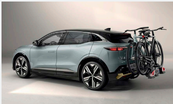
Coach kerékpártartó vonóhorogra 247 590 Ft