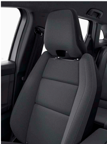
sötétszürke szövet üléskárpit újrahasznosított anyagokból