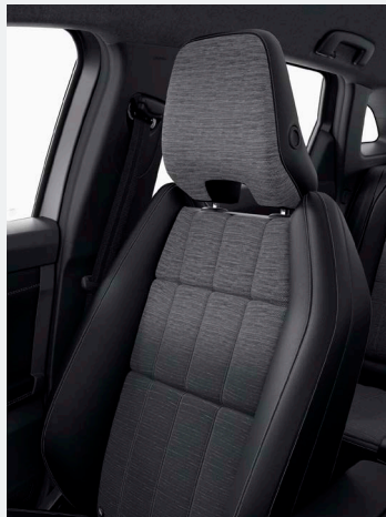
fekete műbőr- és szürke szövet üléskárpit