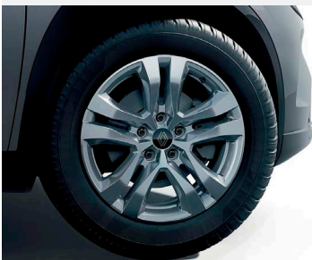
17" könnyűfém MAHA keréktársa