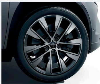
19" könnyűfém KOMAH keréktársa