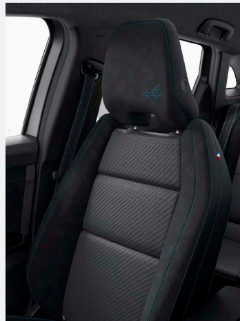
sötét Alcantara bőr betétes szövet üléskárpit Alpine kék varrásokkal