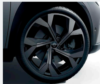
20" könnyűfém DAYTONA keréktársa