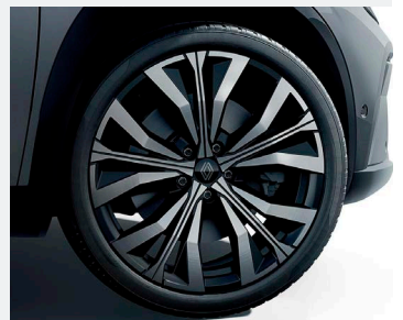
20" könnyűfém EFFIE keréktársa