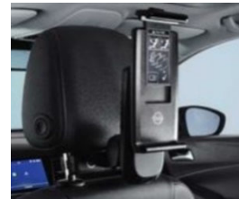
2 univerzális tablet tartó 2 moduláris csatlakozó