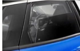
Hátsó és hátsó oldalsó árnyékoló szett