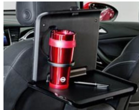
2 pohártartós asztalka 2 moduláris csatlakozó