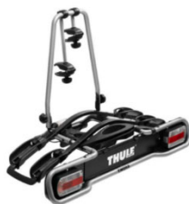
Euroride 941 2 db-os bicikli tartó, lehajtható