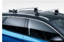
Keresztirányú tetőrudak hosszanti tetősínhez