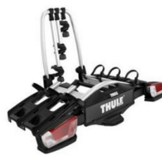
Coach 276 3 db-os bicikli tartó