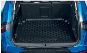
Mosható gumi csomagterétálca