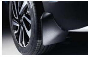
Hátsó öntött sárfogó készlet