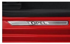
Első alumínium hatású Opel küszöbborítás