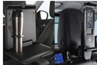
1 asztalka + 1 univerzális tablet tartó + 2 csatlakozó