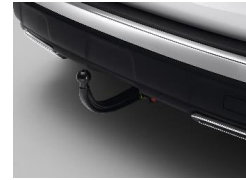
Szerszám nélkül leszerelhető vonóhorog 13 pólusú csatlakozóval