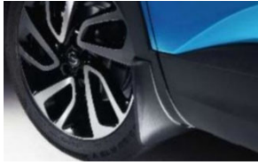
Első öntött sárfogó készlet