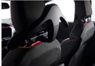
FlexConnect moduláris csatlakozó és vállfa