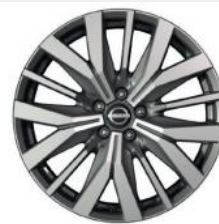
20"-OS KÖNNYŰFÉM KERÉKTÁRCSÁK (Opció)