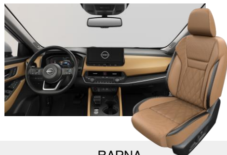
BARNA NAPPABŐR ÜLÉSEK [C]