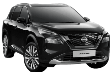
Fekete G41 - 210 000 Ft