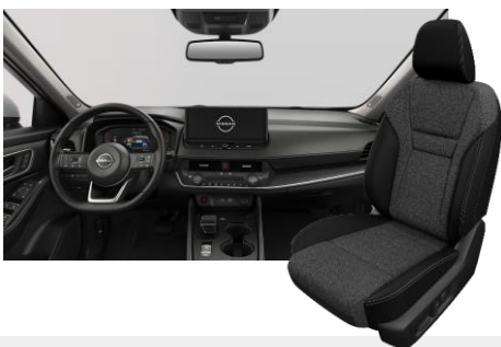
FEKETE SZÖVET ÜLÉSEK [G]