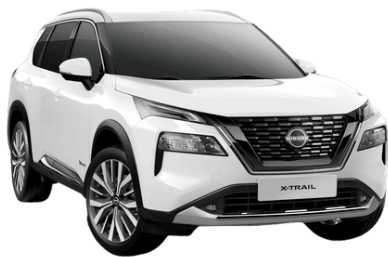
Alap fehér QAK