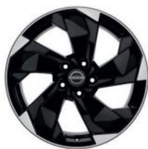
18"-OS KÖNNYŰFÉM KERÉKTÁRCSÁK