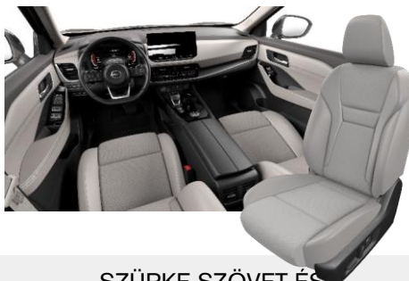
SZÜRKE SZÖVET ÉS SZINTETIKUS BŐRÜLÉSEK [K]