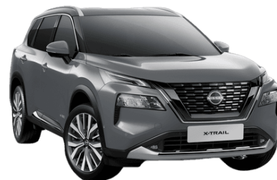
Gyöngyház szürke KBY - 250 000 Ft