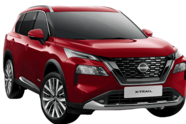
Sötét vörös NBL - 250 000 Ft