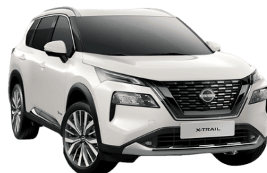
Gyöngyház fehér QBE - 250 000 Ft