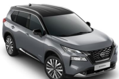
Gyöngyház szürke - Fekete XEX - 450 000 Ft