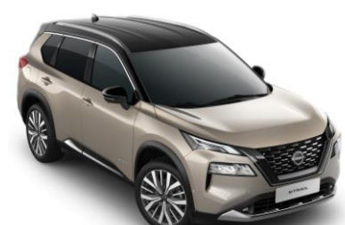
Pezsgő ezüst - Fekete XEW - 450 000 Ft