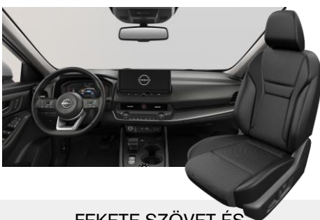
FEKETE SZÖVET ÉS SZINTETIKUS BŐRÜLÉSEK [G]