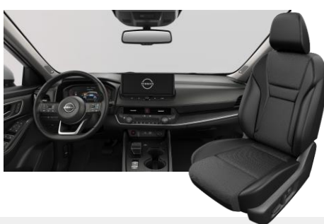
FEKETE SZÖVET ÉS SZINTETIKUS BŐRÜLÉSEK [G]