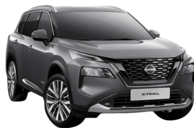
Szürke KAD – 210 000 Ft