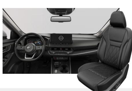
FEKETE NAPPABŐR ÜLÉSEK [G]