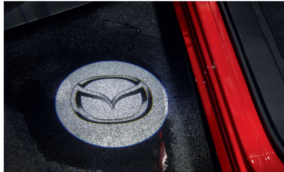
Ajtóba szerelhető LED-es Mazda logó kivetítő