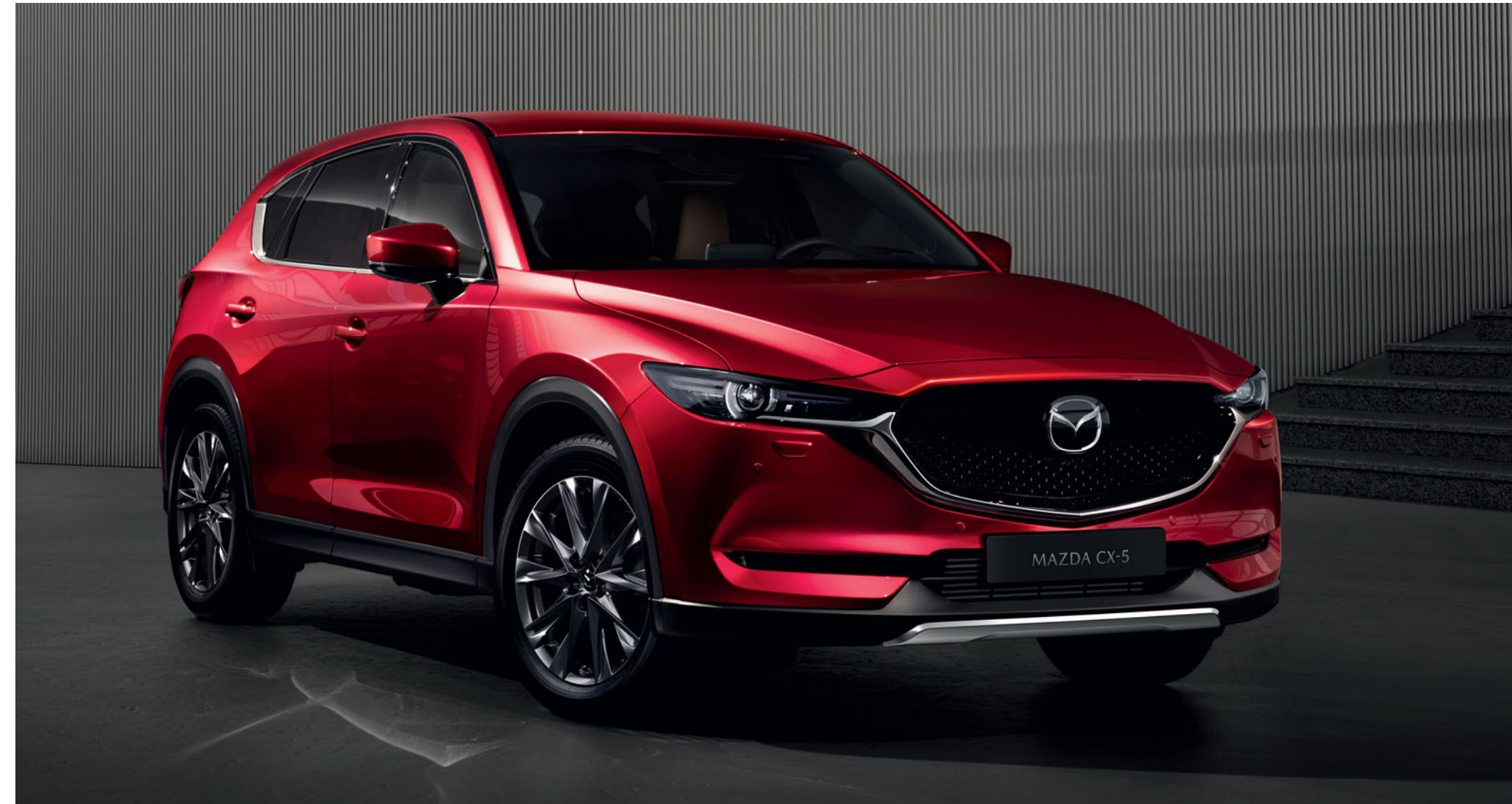
Karosszéria alatti díszbetét