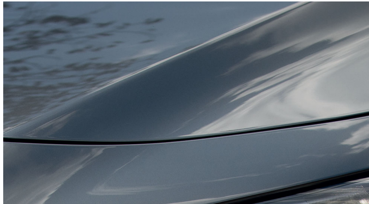
Machine szürke metál

Látogasson el webhelyünkre, ahol megtekintheti a rendelkezésre álló élénk színek választékát.