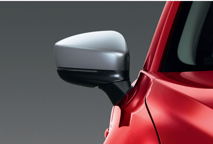
Ezüst színű tükörház borítás

A Mazda olyan kiegészítőket tervezett, melyek tökéletesen illeszkednek az Ön autójának megjelenéséhez.