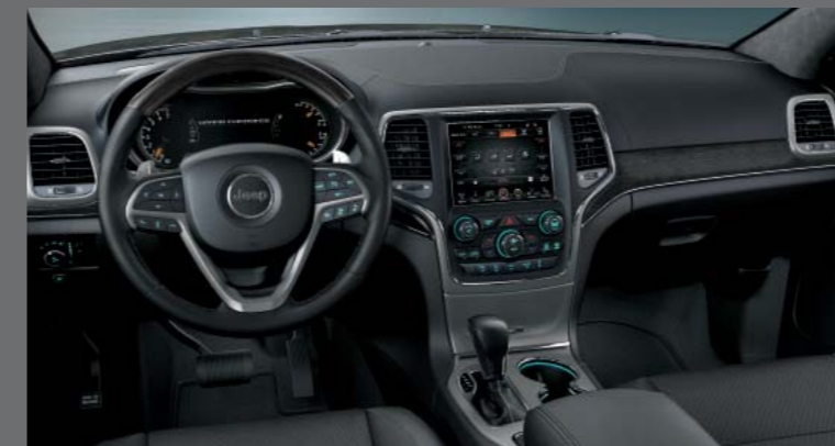
MAROKKÓ FEKETE NATURA PLUS BŐR