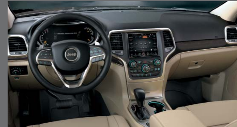
ZIMBABWE BÉZS BŐR