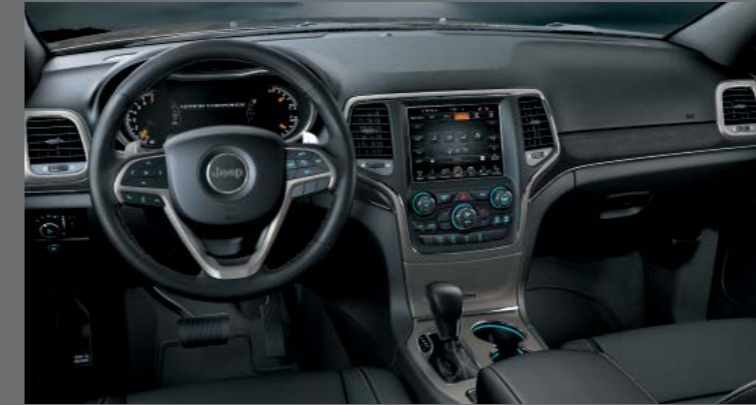
MAROKKÓ FEKETE BŐR