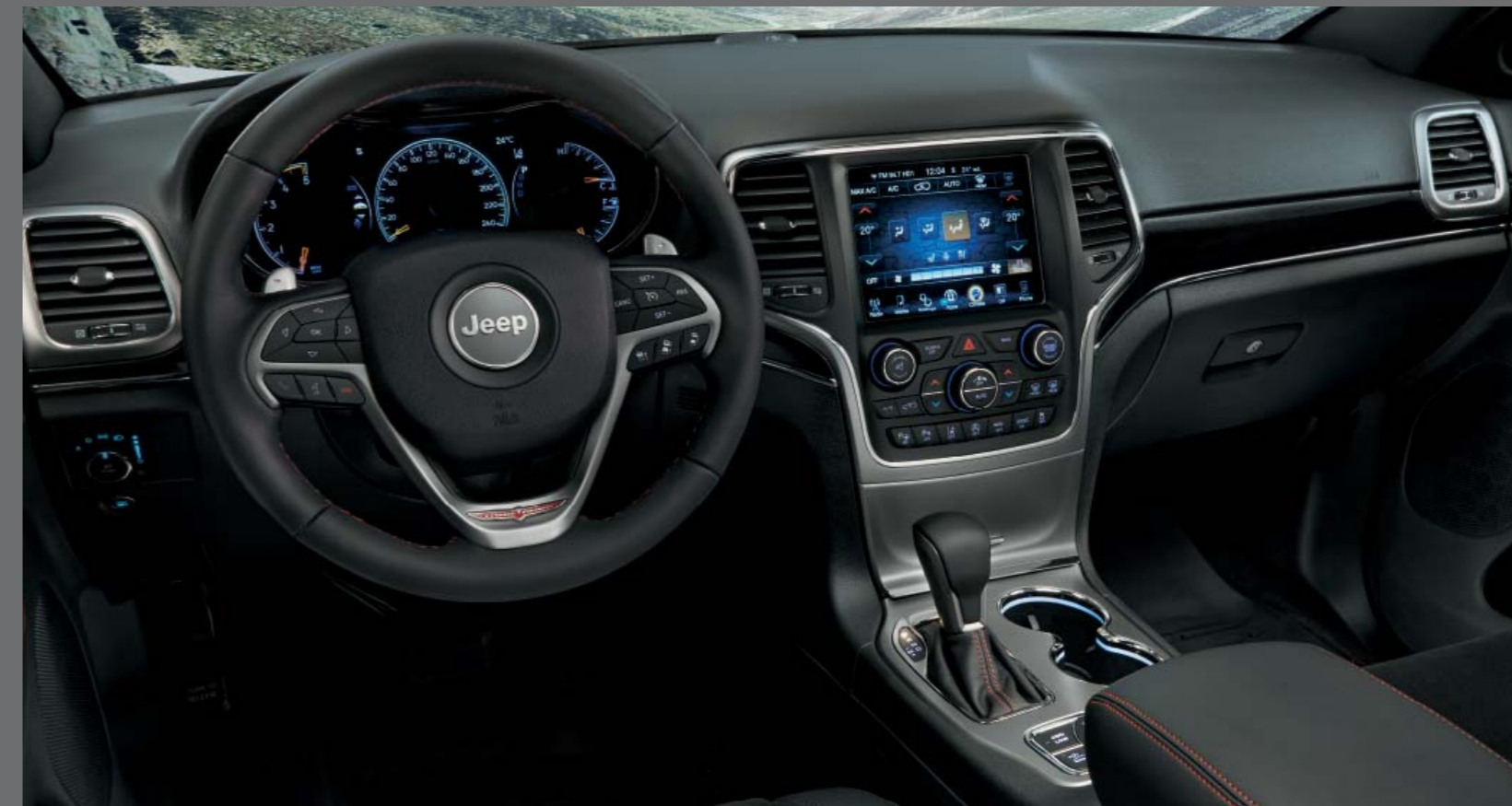
FEKETE NAPPA BŐR/PERFORÁLT HASÍTOTT BŐR