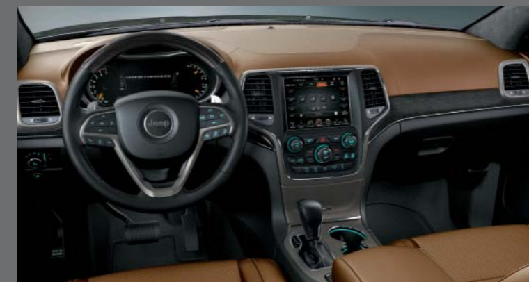
SIENNA BARNA NATURA PLUS BŐR