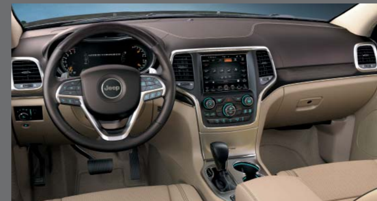
NEPAL BÉZS NAPPA BŐR