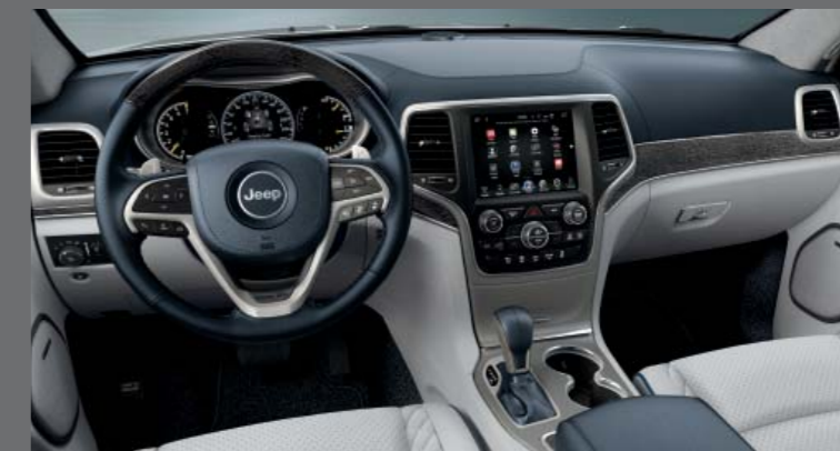
INDIGÓ KÉK/SÍ SZÜRKE LAGUNA BŐR