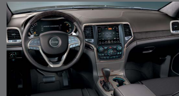
GRAND CANYON SÖTÉTBARNA NATURA PLUS BŐR