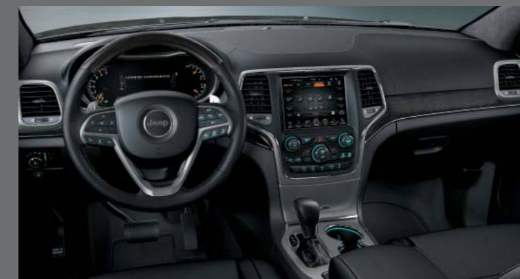
SPORT FEKETE LAGUNA BŐR