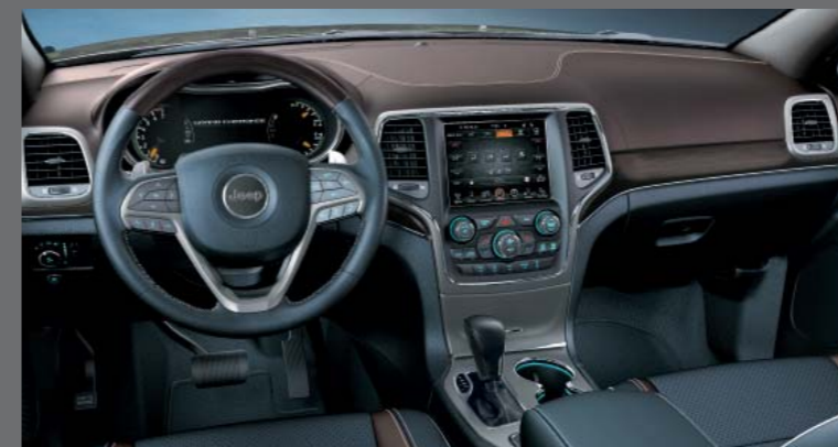
VESUVIO KÉK/BARNA BŐR