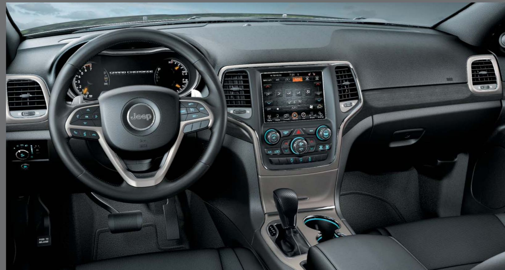
MAROKKÓ FEKETE SZÖVETKÁRPIT