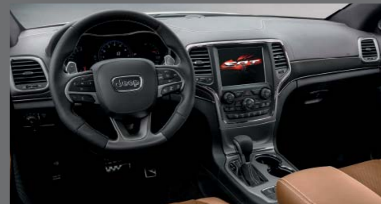
SEPIA BARN NAPPA BŐR