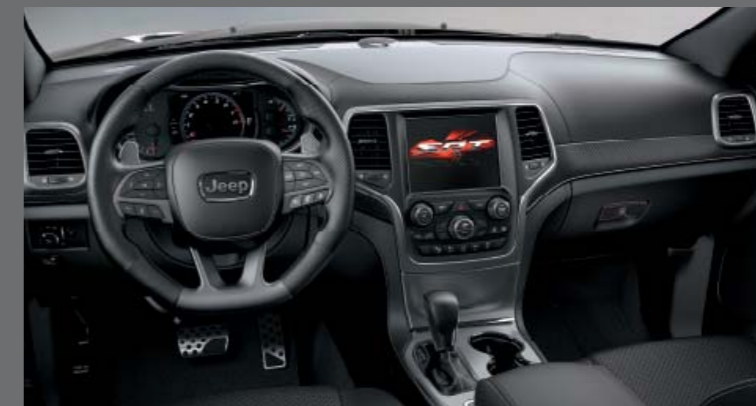
FEKETE LAGUNA BŐR