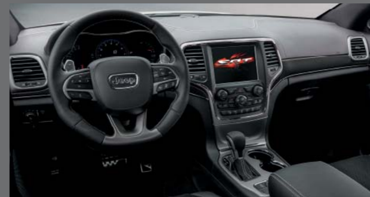
FEKETE NAPPA BŐR/PERFORÁLT HASÍTOTT BŐR