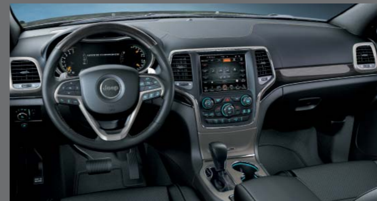
MAROKKÓ FEKETE NAPPA BŐR