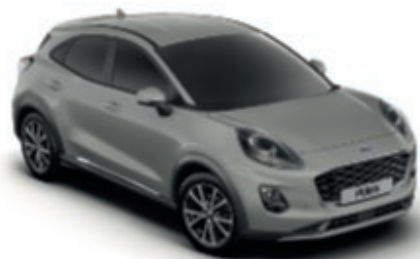
Grey Matter metálfényezés*