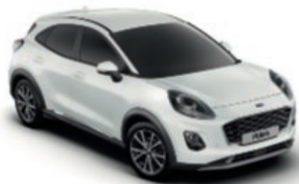
Frozen White alapszín