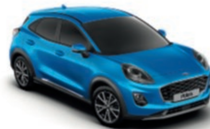
Desert Island Blue metálfényezés*