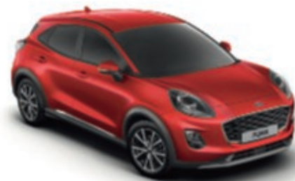
Lucid Red színezett, áttetsző fedőlakk metálfényezés*