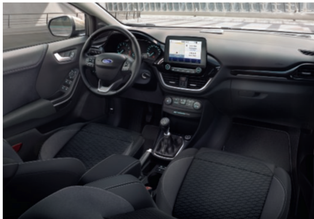
Puma Titanium Solar Silver metálfényezéssel (választható). Puma Titanium belső alapszereltsége 8"-os SYNC 3 érintőképernyős kijelzővel.