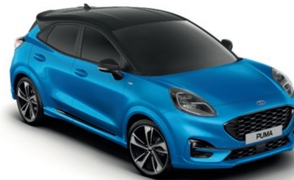
Desert Island Blue* metálfényezéses karosszériaszín Agate Black metálfényezéses tető- és ajtóükrök*

A Ford Puma egy speciális, többlépcsős fényezési eljárásnak köszönheti tartós és gyönyörű külsejét. A viaszos üregvédelemmel ellátott acél karosszériaelemektől a fedőlakkréteg nyújtotta védelemig, az új anyagok és felhordási eljárások biztosítják, hogy az összes új Puma gépkocsi még sok évig megőrizze vonzó külsejét.