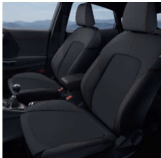
Court és Belgrano kárpit

Ebony színben a Titanium X-hez, cipzáros üléssel (alapfelszereltség)