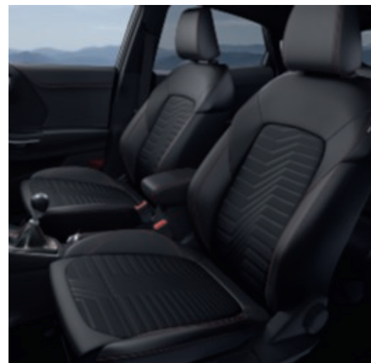
Tire on Casual kárpit részben Salerno bőrrrel

Ebony színben az ST-Line-hoz (alapfelszereltség)