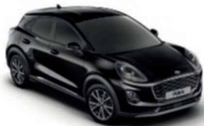
Agate Black metálfényezés*