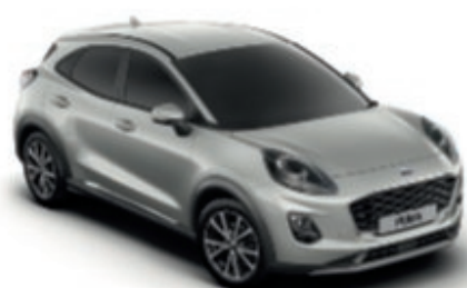
Solar Silver metálfényezés*