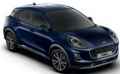
Blazer Blue alapszín