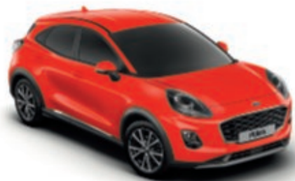
Race Red alapszín