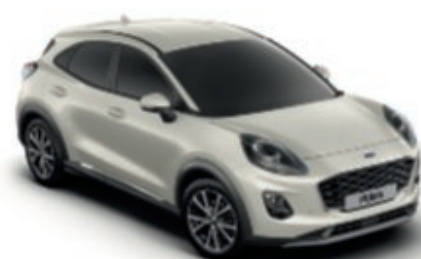
Metropolis White metálfényezés*