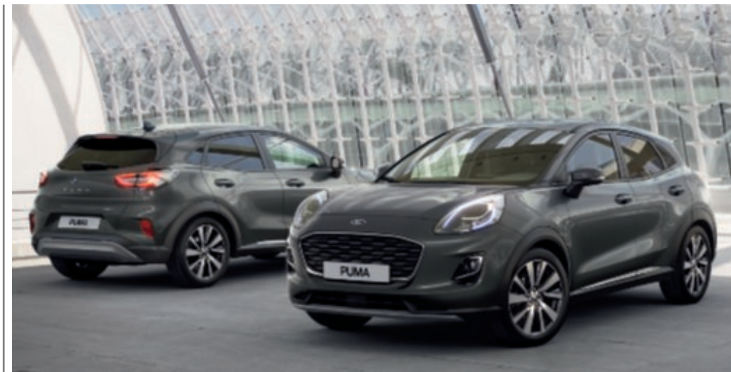
Puma Titanium X Solar Magnetic metálfényezéssel (választható). Puma Titanium X belső alapszereltsége a Ford Power indítógombbal.