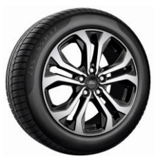
17" ST-Line Standard