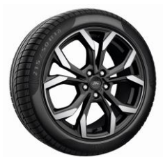
18" ST-Line X Standard