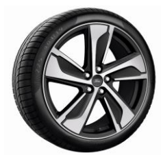
19" ST-Line/ST-Line X Külső Dizájn csomagban érhető el