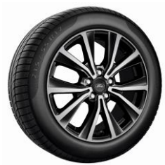
17" Titanium Standard

2021.25-ös modellév - 2020/8 Érvényes: 2020. október 19-i gyártástól A változtatás jogát fenntartjuk!