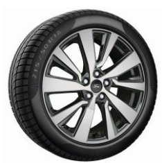
18" Titanium X Standard