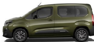
Sírkka zöld (M)