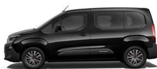
Perla Nera fekete (M)