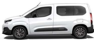
Kaolin fehér (S)