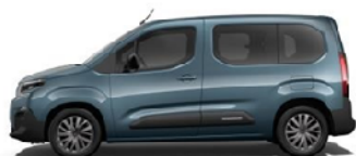
Kiama kék (M)