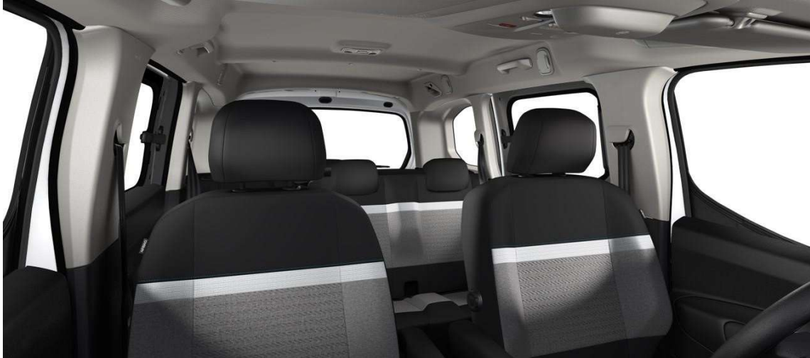
URBAN GREY BELTÉRANGULAT